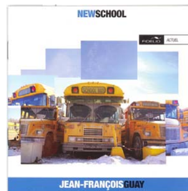
NEWSCHOOL ROBERT LEMAY Cinq études pour saxophone