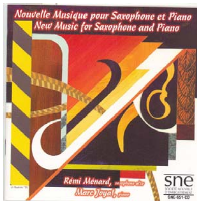
NEW MUSIC FOR SAXOPHONE AND PIANO ROBERT LEMAY Incertitude