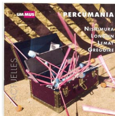
PERCUMANIA ROBERT LEMAY La Soif du mal, Hommage à Orson Wells